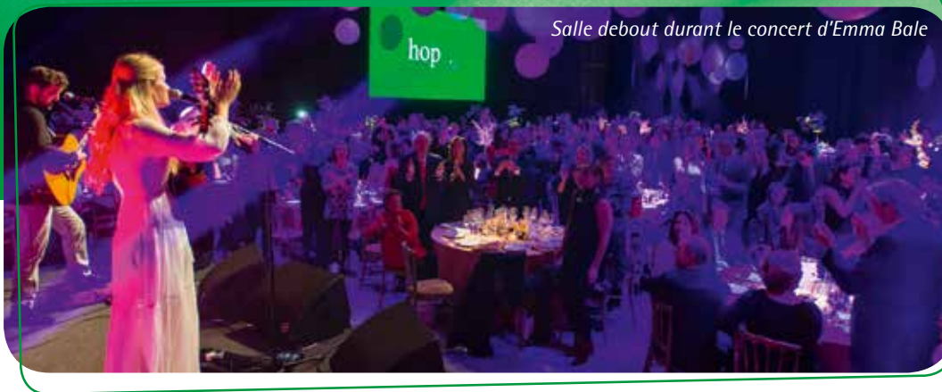
Salle debout durant le concert d'Emma Bale