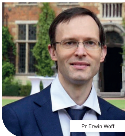
Pr Erwin Woff

sur l'intelligence artificielle en imagerie moléculaire. Un domaine très prometteur en cancérologie. Nous ne manquerons pas de vous tenir informés des avancées de ses travaux.