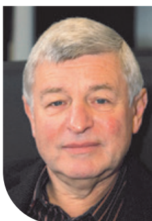
Pr Wolf Hervé Fridman, Président

DES EXPERTS SCIENTIFIQUES MONDIALEMENT RECONNUS POUR LEUR EXPERTISE EN ONCOLOGIE