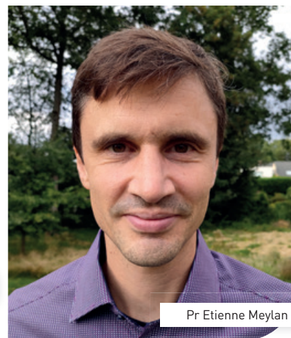
Pr Etienne Meylan

du cancer du poumon. Ses travaux devraient également permettre à terme de mieux comprendre la survenue d'autres types de cancer comme le cancer du sein ou le mélanome ainsi que la réponse aux traitements.